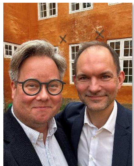
Jeppe Bruus, Minister for Grøn Trepert

Social dumping skal bekæmpes konsekvent. Kommunerne skal forpligtes til at anvende stærke arbejds- og sociale klausuler i alle udbud for at sikre ordentlig løn og arbejdsforhold. Brugen af uddannelses- og lærlingeklausuler skal styrkes for at sikre lokale jobs og fair konkurrence.