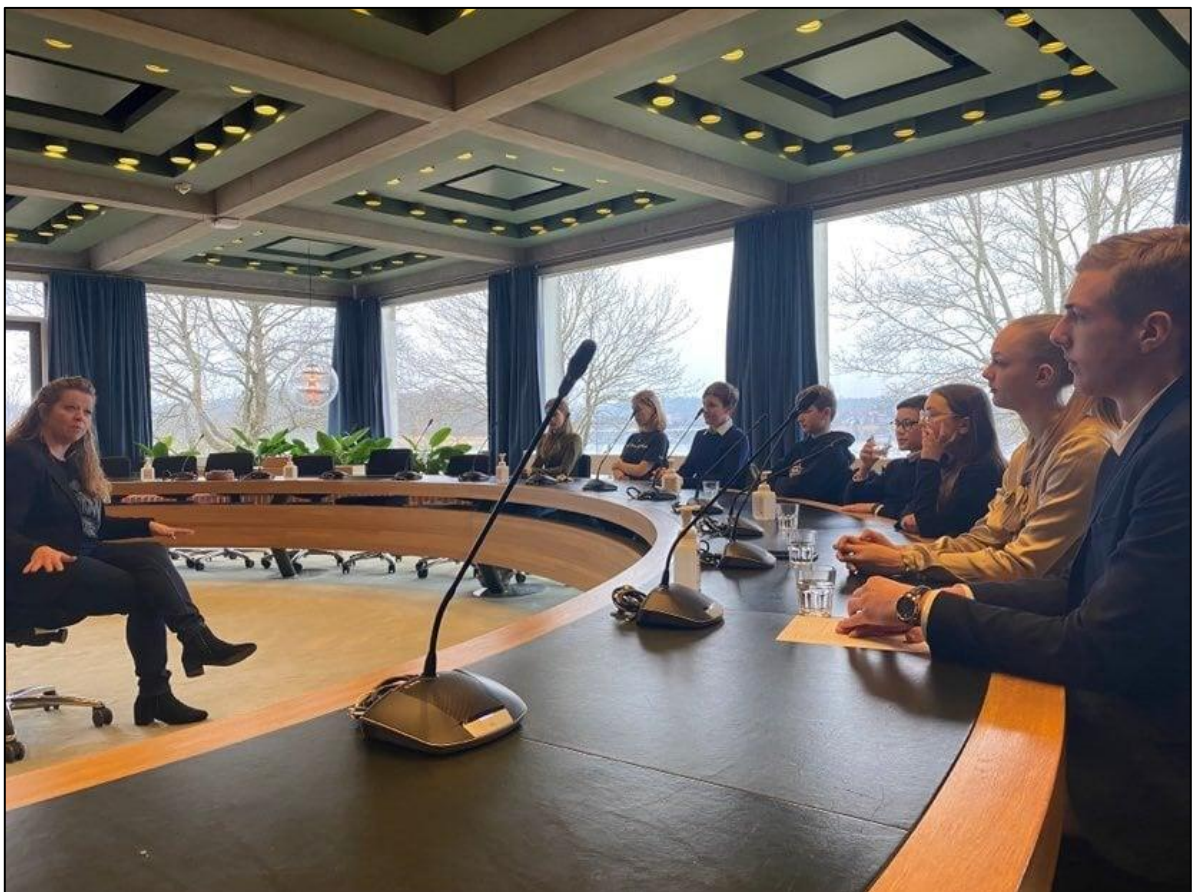
Møde i Ungebyrådet, marts 2022

Silkeborg Kommune har tidligere haft et Ungebyråd – nu er det tid til at genindføre det. Ikke for symbolikken, men for at sikre, at de unges stemmer bliver taget mere alvorligt i kommunens beslutninger. Lad os give de unge en stemme og en reel mulighed for at forme deres egen fremtid!